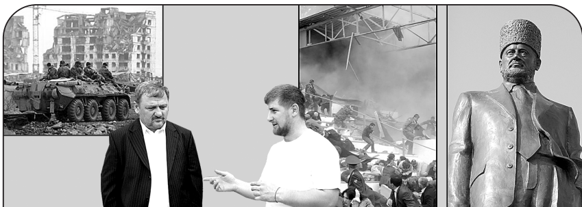
Так выглядел Грозный в 1995 году

И Ахмад Кадыров в 2004 году был убит террористами во время праздничного парада ко Дню Победы на стадионе в Грозном. За что? Он срывал их планы.